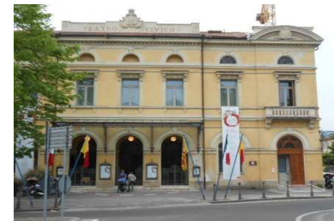
Teatro Comunale di Schio

Il suo percorso di studi si è fatto in Italia e in Francia tra filosofia, storia, storia dell'arte e architettura, da Padova alla Sorbonne. Docente di Storia dell'Architettura e poi di Estetica, ha lavorato al Centro Studi di Architettura Andrea Palladio nei suoi primi anni, quindi alla Sorbonne IV e ha tenuto corsi e seminari in prestigiose Università americane. Docente del FAI Fondo per l'Ambiente Italiano dagli anni ottanta, direttore di A.R.P.A.I. Associazione per il restauro del patrimonio Artistico Italiano da vent'anni, ha viaggiato in tutto il mondo per dirigere itinerari di studio per numerosi musei americani e fondazioni culturali. Numerose pubblicazioni di storia dell'architettura e saggi di critica artistica. Artista pittore ha esposto in varie città europee e americane. Come direttore di A.R.P.A.I. è impegnato attualmente nella campagna di restauro degli affreschi di Giotto della Cappella Bardi a Santa Croce in Firenze. Il restauro è alle soglie di essere avviato e si produrrà nel corso di tre anni. Vive a Vicenza e a Parigi.