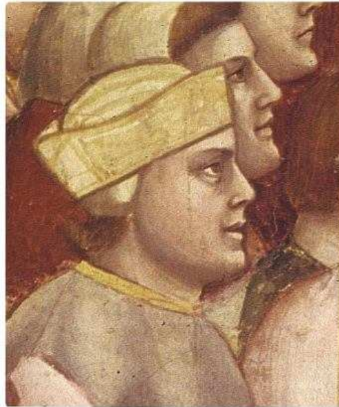
Giotto: Autoritratto, controcaccia, giudizio universale, gruppo degli eletti, Cappella di Enrico Scrovegni, Padova

Signori, Mercanti, Banchieri ed Artisti"