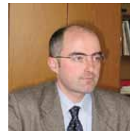
STEFANO MICELLI Economista, autore di Futuro artigiano