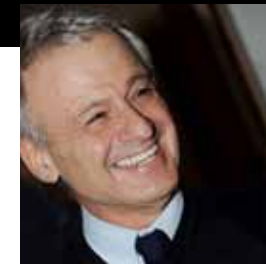
CORRADO CLINI Ministro dell'Ambiente

Sabato 5 maggio, ore 18.30 - Oratorio del Cristo (largo Ospedale Vecchio) DIVORATORI DI TERRA. CONSUMO DEL SUOLO E DEGRADO AMBIENTALE Incontro del festival vicino/lontano