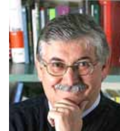
GIAN ANTONIO STELLA Giornalista Corriere della Sera