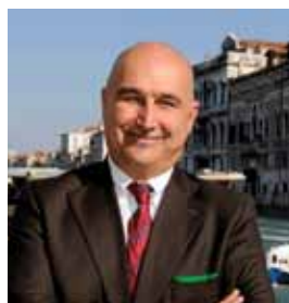
MARINO FINOZZI Assessore alle Politiche del Turismo, Regione Veneto