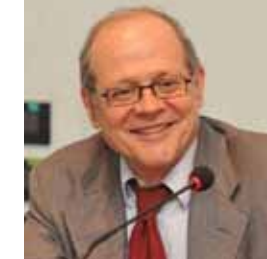
TIZIANO TREU Senatore