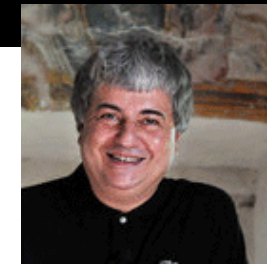
ERMETE REALACCI Presidente Fondazione Symbola

Sabato 5 maggio, ore 22.30 Chiesa di San Francesco (lgo Ospedale Vecchio) IMPATTO AMBIENTALE ZERO. ZERO CONFINI Incontro con Corrado Clini, ministro dell'Ambiente (Italia) e Roko Žarni, ministro dell'Ambiente (Slovenia) Incontro in collaborazione tra vicino/lontano e Nordesteuropa